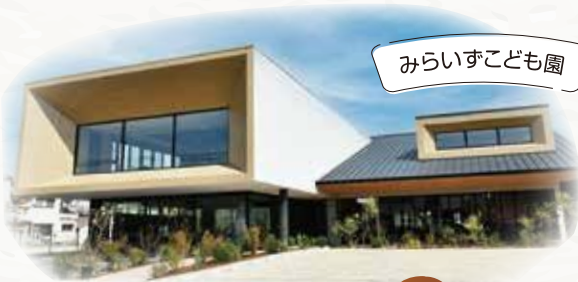
みらいすこども園

令和8年4月、緑豊かな市内公園内に「認定こども園ほーみい」がオープン! また「みらいすこども園」が場所を変えリニューアルします! 泉大津市の就学前施設では、こどもたちの健やかな成長をサポートし、子育て中のみなさんが安心して子育てができる環境づくりを推進しています。