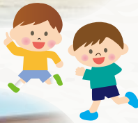
認定こども園ほーみい