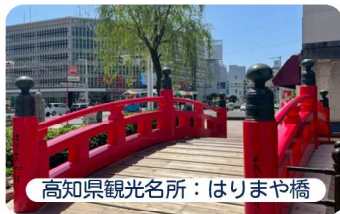
高知県観光名所：はりまや橋

夕食は自由散策！新鮮な海の幸や野菜など、魅力いっぱいの高知県で、美味しいごはんを食べて、明日に備えてしっかり休もう！