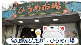
高知県観光名所：ひろめ市場