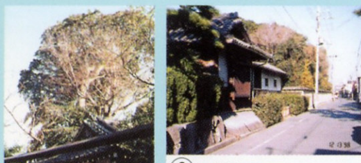
1 助松神社 昔は奥の方に池があったよ。