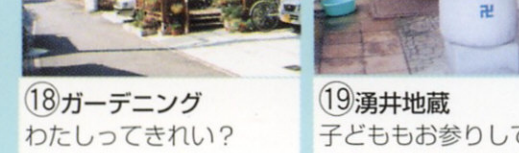
18 ガーデニング わたってきれい？もちろん。花と緑の装いはステキ！