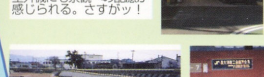
9 浜街道 室外機にも景観への配慮が感じられる。さすが！