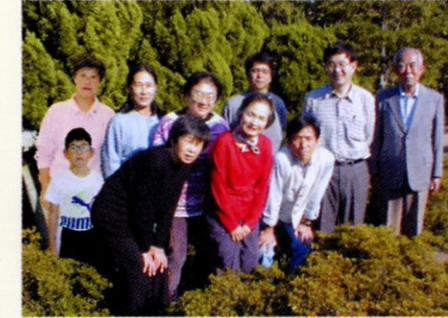
地図を作ったメンバー