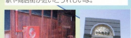
7 8 きららタウン ヤシの木と水辺のエキゾチックを訪ねよう。駅や商店街が近いとれいな。