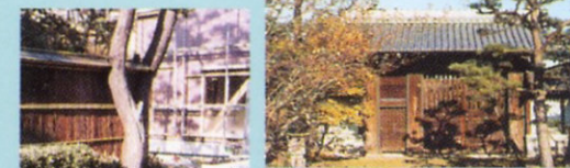
2 紀州街道 本陣あたりの道は「い〜感じ♪」