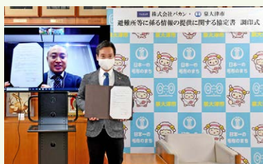
災害協定のオンライン調印式の様子

これにより、災害時にはパソコンやスマートフォンなどで下記の専用サイトにアクセスすることで、各避難所の位置や混雑具合をリアルタイムで確認することができるようになりました。