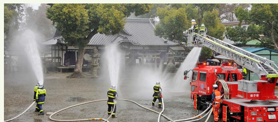
消防団と消防職員による力強い放水