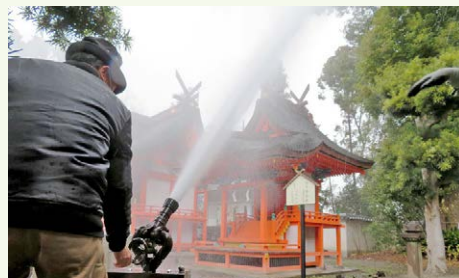
自衛消防隊による放水風景

また、訓練終了後、消防職員が立入検査を実施し、拝殿などの消防用設備の確認や火災予防について助言を行いました。