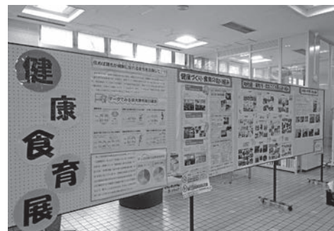
昨年の展示会の様子

日時 3月15日(月)～26日(金) 最終日のみ午後4時まで 場所 市役所1階ロビー 問合 保健センター