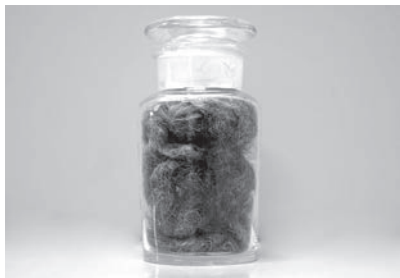
毛布に利用されていた牛毛(織編館所蔵)