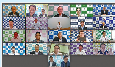
オンラインでの会議の様子

全国各地で自然災害が頻発している中、いつ災害が起きても市民の皆さんの安全・安心を守ることができるよう、今後も各市町との連携を深めていきます。