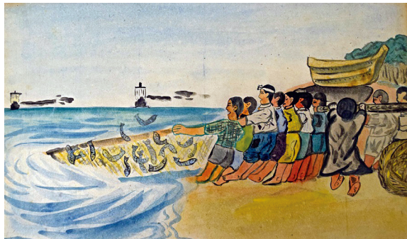
地引網漁の場面（紙芝居「里の一年」より）

安立国民学校（大阪市）の子どもたちは、本市各地の疎開寮で1944年9月17日から戦争が終わるまで疎開生活をおくりました。疎開していた期間に子どもたちが作成した紙芝居には、本市の人たちと交流する姿が描かれています。