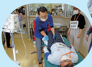
救護室での初期対応の様子

集団接種時は、医師・看護師・薬剤師など各医療機関が参加します。このような訓練により、安全かつ迅速に集団接種を進めるため、共通認識とさらなる連携を深めることができました。これらの経験を活かし、集団接種を円滑に進めていきます。