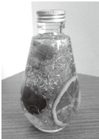
(写真は見本です。中身は変更になる場合があります)

日時 12月20日(金) 午前10時～11時30分 場所 にんじんサロン(図書館2階) 定員 先着24人 一時保育 先着3人(6か月～未就学児、12月13日(金)までに申し込み) 材料費 800円 持物 薄手のナイロン手袋・はさみ・持ち帰り用袋 申込・問合せ 12月11日(水)午前9時30分から直接または電話(☎21・6555)でにんじんサロンへ