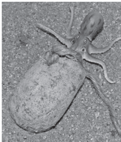
イイダコ壺と体長約10cmのイイダコ(再現)