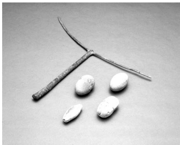
池上曽根遺跡で出土したタモの柄と土錘・石錘 （府立弥生文化博物館 所蔵）