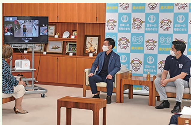
まごチャンネル(テレビを使った新しい情報伝達方法)の視察