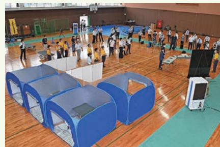
避難スペースの配置を確認