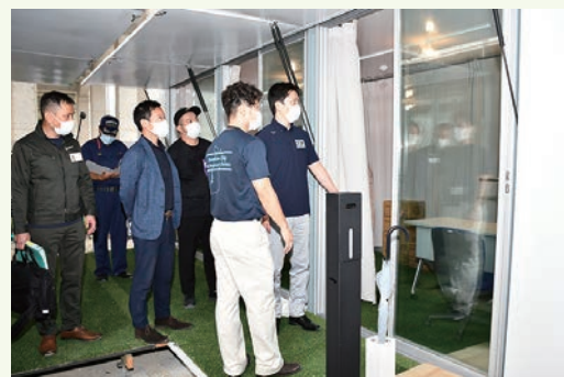
移動可能なコンテナ型シェルターを視察 (もとんパークとなり)