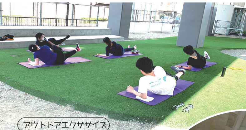
アウトドアエクササイズ