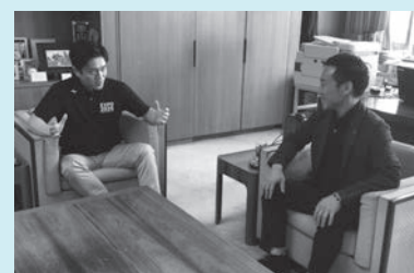
訓練を終えて対談する2人