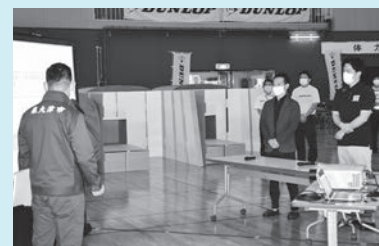
市内企業と連携した避難所について紹介