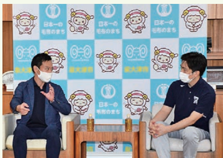
コロナ禍での新しい災害対策について知事と市長が 意見交換