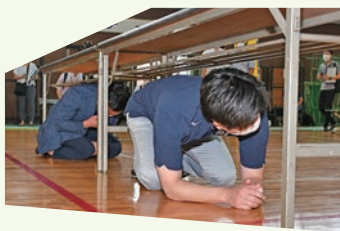
地震が起きた時は身を守ろう! (左・市長/右・知事)