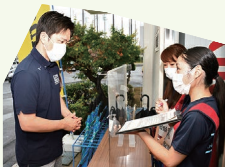
避難所へ入る前に健康チェック