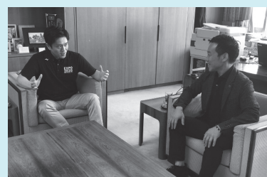
訓練を終えて対談する2人