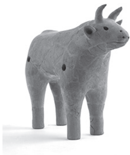
牛形埴輪 今城塚古墳（高槻市所蔵）

牛はもともと日本にはいない動物であることはご存じでしょうか。では日本人は、そして泉大津の人びとはいつごろ牛と出会ったのでしょうか。