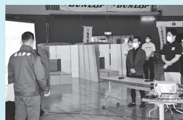
市内企業と連携した避難所について紹介

府知事には、大変ご好評をいただき、本市の取り組みについて、大阪府下の自治体にも共有したいと評価いただきました。