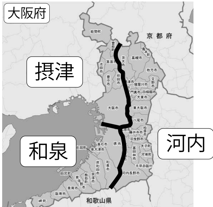
大阪府の方言区画

言葉には地域の文化が大きく関わり、特有の言葉を使う地域では、気づかいうちにその地域特有の見方や考え方をしてしまうことがあります。