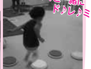
ママと一緒に ドリしゅミ