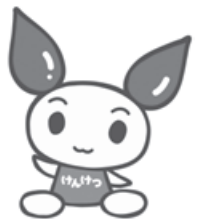
↑献血キャラクター けんけつちゃん

日時・場所 ▽9月2日(日) 午前10時～午後4時 泉大津郵便局(正午～午後1時まで休憩) ▽12日(木) 午前10時～午後4時 30分 大津神社 問合 献血推進協議会(☎23・1393)