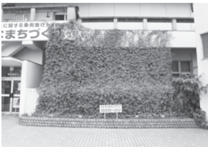
↑市役所の緑のカーテン

「緑のカーテン」とは、つる性植物（ゴーヤ・アサガオ・へちまなど）をベランダや窓の外部にはわせる事により、カーテンのように覆い夏の暑い日差しを効果的に遮り、目にも地球にも優しい自然のカーテンです。