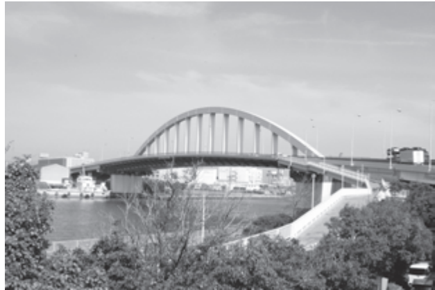
助松ふ頭と小松ふ頭を結ぶ泉大津大橋