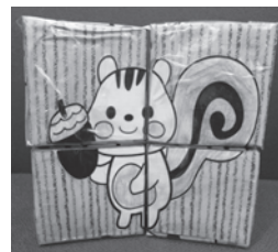
「絵合わせ」完成イメージ

毎年10月19日は「イクメンの日」です。にんじんサロンでお子さんと一緒に協力して牛乳パックを使ったオリジナルの「絵合わせ」作りに挑戦してみませんか！もちろん「イクジイ」もお孫さんとの参加OK！ 日時 10月21日(土) 午前10時～正午 場所 にんじんサロン（図書館2階） 対象 男性保護者とその子ども（工作は4歳～小学校低学年向け） 定員 先着10組 持物 のり・ハサミ・色鉛筆 申込・問合せ 10月11日(水)からにんじんサロン（☎21・6555）窓口または電話にて