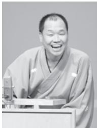
落語家 笑福亭松枝氏

日時・内容 ▶第1回（11月10日(金) 午後1時～2時）…「巧妙化する悪質商法の手口」（消費生活センター・相談員） ▶第2回（17日(金) 午後1時～2時）…「危険がいっぱい！インターネットトラブル」（田村康正弁護士） ▶第3回（27日(月) 午後1時～2時30分）…「悪は進化します！負けるな！善良市民」（落語家 笑福亭松枝氏） 場所 市役所3階大会議室 対象 市内在住・在勤の人 定員 60人 受講料 無料 申込・問合せ 第1回は11月2日(木)、第2回は10日(金)、第3回は17日(金)までに秘書広報課（市役所4階）へ電話予約