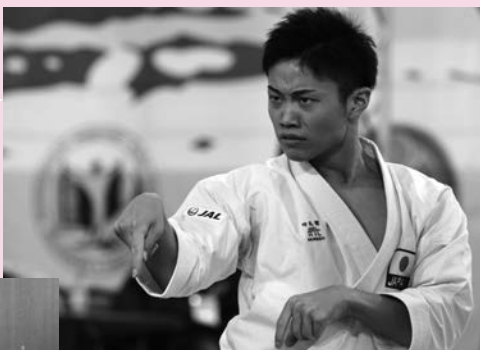
アジア大会 U21 での演武