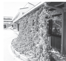
↑くすのき認定こども園の緑のカーテン

では、忠岡町交通安全推進協議会と共催で、「交通マナーを高めよう」をテーマに、「交通安全大会」を開催します。 日時 10月5日(木)：午後1時30分～ 場所：忠岡町ふれあいホール ■駐輪場を利用しましょう 市内の泉大津駅・松ノ浜駅・北助松駅の周辺は、自転車などの放置禁止区域となっています。禁止区域内に放置された自転車などは、放置車両とみなして、保管場所へ移送します。放置自転車などは、歩行者の通行障害や緊急活動の阻害、街の美観を損なうなどの迷惑がたくさんありますので、安易な気持ちで自転車を放置せずに、必ず駐輪場を利用しましょう。 利用料金など詳しくはホームページをご覧ください。 問合 土木課（市役所2階22番窓口）