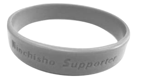
認知症サポーターの証 オレンジリング

○中央商店街・風街(毎月・第4水曜日・午後1～3時)※参加費無料／飲み物代100円 ○愛の家グループホーム「いけうら」(偶数月・第3土曜日・午後1時30分～3時)※参加費無料