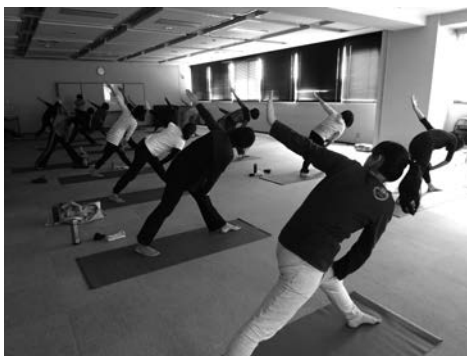
←リフレッシュ・ヨガの様子

申込・問合せ 5月10日(木)から、月～金曜日の午後1時～4時に地域子育て支援センターへ電話にて