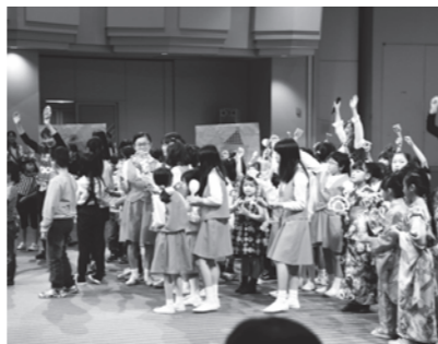
ごかんのおまつりの様子