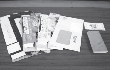
↑可能な限り地域の有価物集団回収に出してください。

平成27年度に家庭から回収した可燃ごみの量は、1万1,640tでした。平成26年度の1万1,681tと比較すると0.4%の減量となり、ごみの減量効果は鈍化傾向にあります。しかし、まだ、ごみは減量できます。泉北クリーンセンターで実施している組成分析の平成27年度の結果は、「紙類」が41.53%と約4割を占め、可燃ごみの中にリ