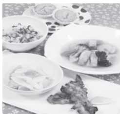
↑お手軽ランチメニュー