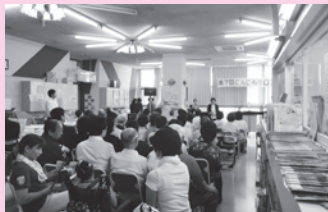
↑去年のにんじんサロンまつりでの様子

日時 6月26日(日) 午後1時30分～3時30分 場所 にんじんサロン（市民会館西側1階） 内容 ▷女性の視点で防災を考えよう！防災講座 ▷にんじんサロンで活動するグループなどのステージでの発表と作品などの展示 など 問合せ にんじんサロン（☎21・6555）