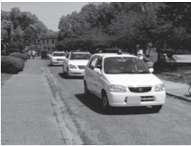
↑ 青色パトロール出陣式の様子

当会では日頃から 28 台のパトロール車で市内を巡回するなどの防犯活動を行っています。