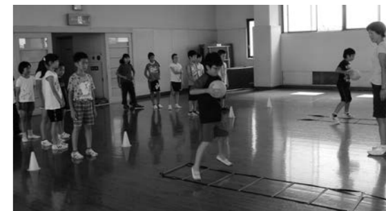
昨年のトータルトレーニング教室の様子

なお、返信用にも住所・氏名を記入のこと。はがき1枚で1教室1人の申し込みが可能です。ただし、定員を超えた場合は抽選となります。