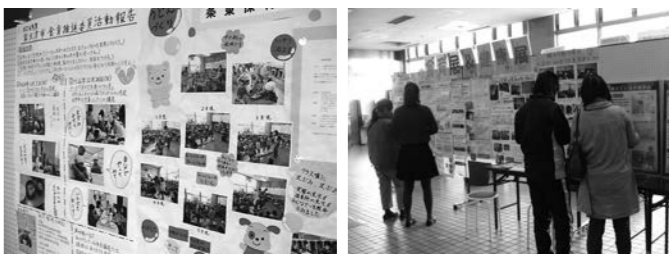
昨年の健康展・食育展の様子

問合 第2次健康泉大津21計画推進委員会・泉大津市食育推進委員会（保健センター ☎33・8181）