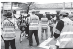
キャンペーン実施の様子