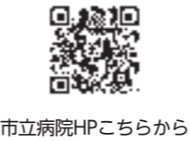
市立病院HPこちらから