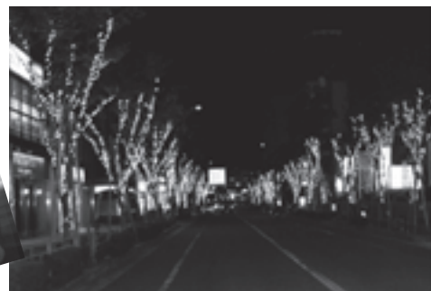
アルザ通りの様子