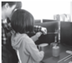
ガラス玉づくりの様子