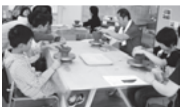
土器づくりの様子