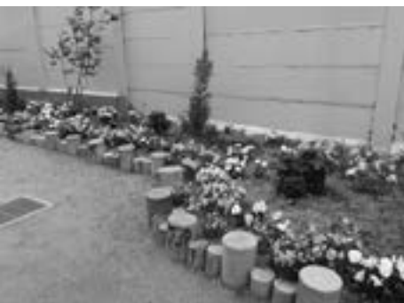
地域の皆さんの協力で四季折々の花を咲かせる花壇

旭幼稚園は“わくわく どきどき 幼稚園って楽しいな”を目標に、いろいろな遊びを通して、健康で明るく、元気いっぱい、そして感性の豊かな思いやりのある子どもたちであるようにと、様々な実践を進めています。