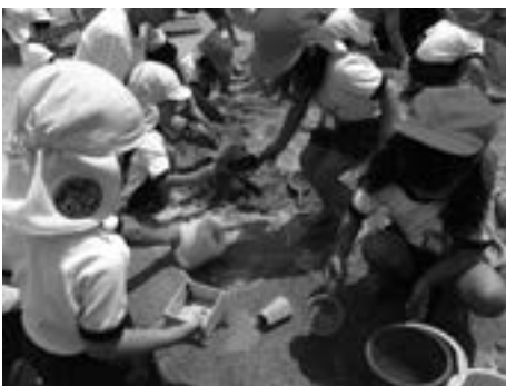
畑あり砂場あり、みんな大好きななかよし広場