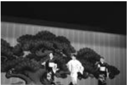
新舞踊を披露する藤豊会のメンバー