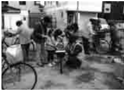
自転車にワイヤー錠をつける防犯委員

泉大津市防犯委員会は、11月に各小学校区内で自転車盗難を防止するため、自転車のワイヤー錠の無料取り付けキャンペーンを行いました。キャンペーンではチラシも配布し、自転車に付いているシリンダー錠と、ワイヤー錠などの2つをかける「ツーロック」を行えば防犯効果が高まることを集まった皆さんに啓発しました。