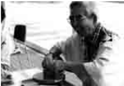
土器づくりの様子