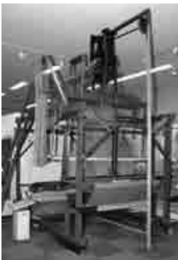
織編館のジャカード織機