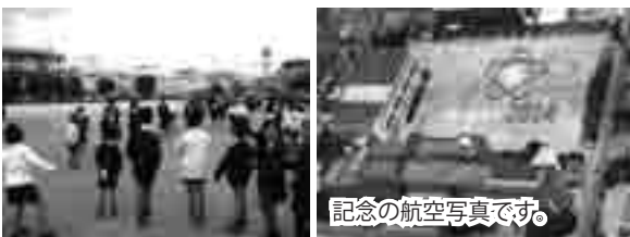
▲「るん☆るん活動」低学年と高学年と一緒に仲良くなわとびにチャレンジ！

条南小学校は、今年度創立 40 周年を迎え、記念に航空写真を撮影し下敷きを作りました。条南っ子は努力目標として、「 じ 」…自分からあいさつをしよう、「 ゆ 」…よく考えて行動しよう、「 う 」…うれしい言葉をつたえよう、「 なん 」…なんでも最後までがんばろうを掲げ、がんばっています。今では元気にあいさつできる子がふえてきています。