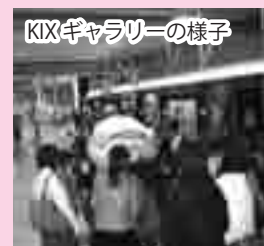
KIX ギャラリーの様子

国内外からの多くの旅行者などで賑わう関西国際空港「KIX ギャラリー」において、「泉大津市＝毛布のまち」のコンセプトを世界に発信するため、昨年 10 月 25 日～31 日にシティプロモーションを実施。空港を行き来する人たちに「毛布のまち泉大津」を呼びかけました。問合せ 地域経済課(☎51・7651)