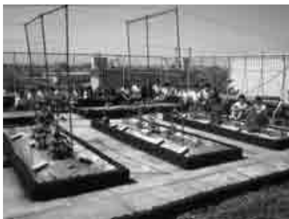
▲「屋上菜園」園芸委員が中心になって野菜作りをがんばっています。