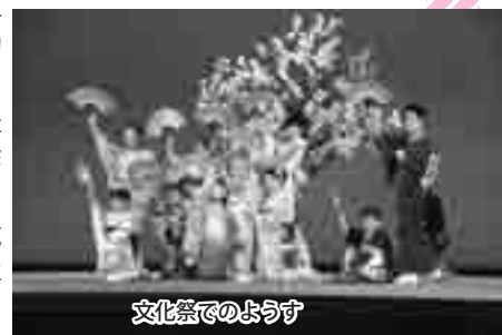
文化祭でのようす