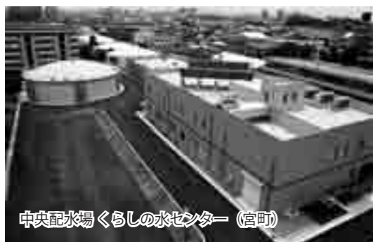
中央配水場 暮らしの水センター（宮町）