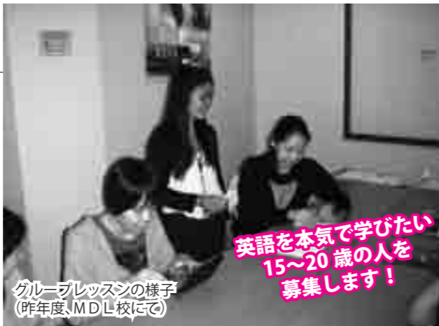
グループレッスンの様子 (昨年度、MDL校にて)