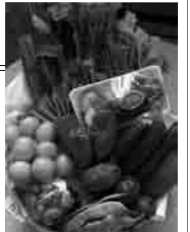
日高川町の新鮮な野菜

泉大津中央商店街にあるショップ「風街」では、毎週金曜日の午前10時から日高川町の産直野菜などを販売しています。 問合 泉大津中央商店街(迫下 ☎090・1154・0842)