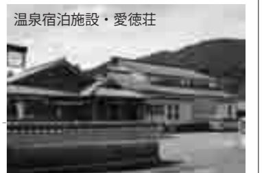
温泉宿泊施設・愛徳荘