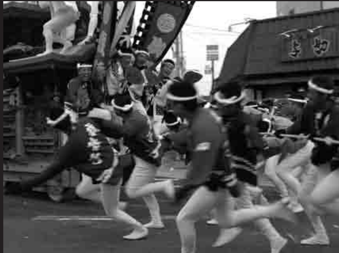
スピードを保ったまま曲がり角を曲がる「やり回し」は、曳き手と前・後艇子の息が合って初めて成功する