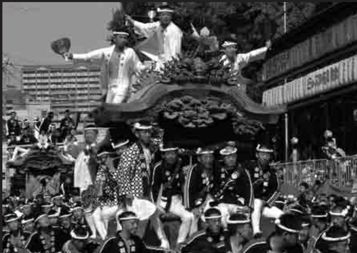
大津神社の宮入の様子。神社前には観覧席も設けられている。曳き手と観客の距離も近く、迫力満点！