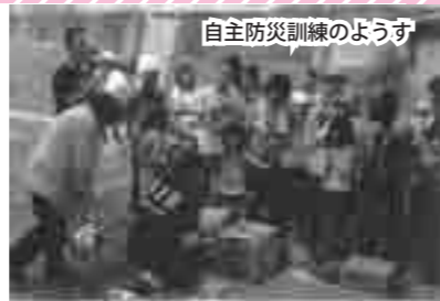
自主防災訓練のようす

今回の訓練には、5～6 歳の子どもたちから高齢の方々まで、70 余人の皆さんが参加してくれました。こういう機会にお互いを知り合えることは、大切なつながりを作るうえでとても有意義なことではないかと思われました。これからも、こういう体験を積み重ね、防災意識の向上を目指し訓練を実施してまいります。