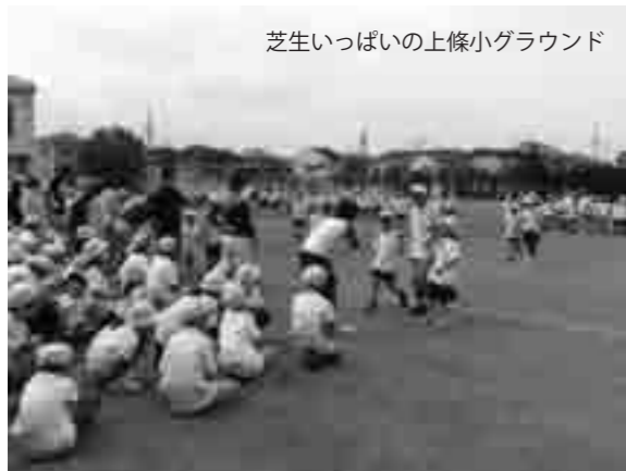
芝生いっぱいの上條小グラウンド