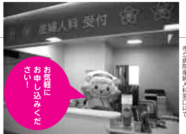
市立病院産婦人科窓口にて

市立病院では、市民の皆さんの健康のために、出前講座を実施しています。 出前講座は、市立病院の職員が指定の場所に出向き、医療や病気のことについてお話しします。 このほど、下表のとおり出前講座のテーマを充実させましたので、ぜひご活用ください。 出前講座実施の主な条件・対象 原則として市内に在住・在勤または在学する、おおむね人以上の団体・グループ 実施時間・場所 1 講座当たり 90 分以内とし、実施場所は原則市内に限る なお、公の秩序を乱し、または善良な風俗に反するおそれのあるとき、また、政治、宗教、営利、陳情、要望を目的とした催しなどを行うおそれのある場合は、出前講座を実施することはできません。 申込・問合せ それぞれのテーマの内容や申し込み方法など、詳しくは市立病院総務課（☎5622）へ また、下表以外のテーマや医師の講座につきましてもご相談ください。