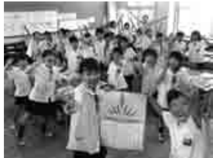
完食賞受賞の喜びに沸く児童たち

上條小学校は、今年で創立 141 年目を迎えますが、何と言っても一番の自慢は、明るく礼儀正しい子どもたちです。朝のあいさつに始まって、大勢が集まっている朝礼でも、私語一つなく整列し、話に集中できる子どもたちがまずは最高の自慢です。