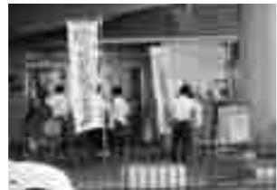
社会を明るくする運動 啓発キャンペーン

7月は法務省主催「社会を明るくする運動」の強調月間です。泉大津市保護司会では、7月1日に東陽中学校生徒会の協力を得て泉大津駅にて「社会を明るくする運動」啓発キャンペーンを行いました。