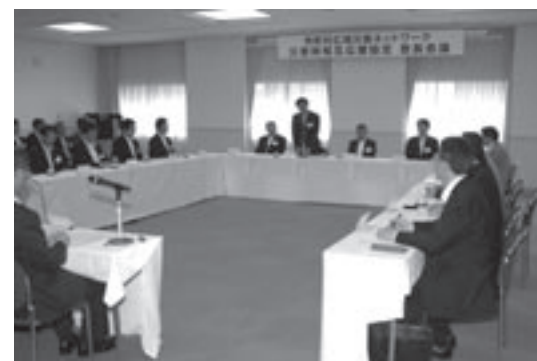
6 月 2 日には、防災に関する「顔の見える」首長会議を開催しました

協定は、20 自治体のいずれかで地震などの大規模災害が発生し、被災自治体独自では十分な応急対策などが実施できない場合に、ほかの各自治体が支援することを目的とします。支援内容は、食料・生活必需物資の供給や、各種資機材の提供、医療機関への被災傷病者や避難者の受入れ、応急支援活動に