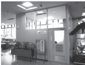
消費生活センター

※消費生活相談に関することは、消費生活センター（月～金曜日の午後1時～4時）にご相談ください。