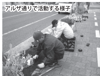
アルザ通りで活動する様子