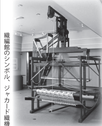
織編館のシンボル、ジャカード織機

伝統から未来へ。先人の確かな足跡を受け継ぎ、泉大津の歩みはこれからも続いていきます。