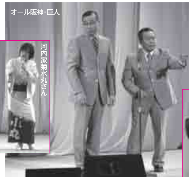
オール阪神・巨人