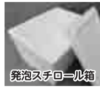
発泡スチロール箱