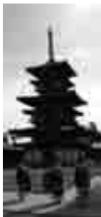
薬師寺東塔（現在解体修理中）