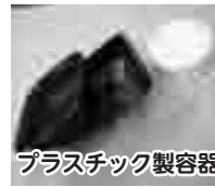
プラスチック製容器