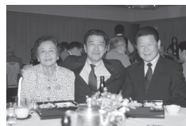
金婚祝賀会での様子

申込・問合せ 8月26日（金）までに印鑑を持参し、高齢介護課（市役所1階8番窓口）へ