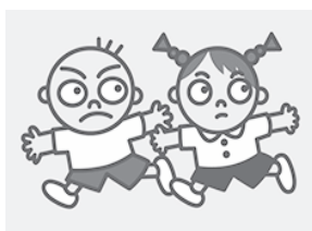
こども110番 ロゴマーク

▽こども110番の家 もしものときに、子どもたちが助けを求めることができるように、地域の協力家庭や店が目印となる旗やステッカーを掲げています。学校や家の近くの「こども110番の家」を探してみましょう。