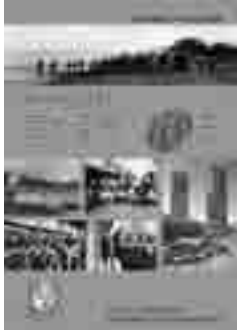
写真集「泉大津市の70年」

販売場所 生涯学習課(市役所3階)、地域経済課(商工会議所2階)、織編館、図書館、南北公民館、商工会議所、市内書店など