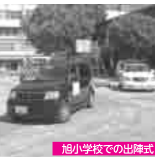
旭小学校での出陣式