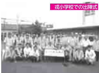
戒小学校での出陣式