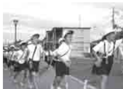
「大阪880万人訓練」市内各所で訓練実施