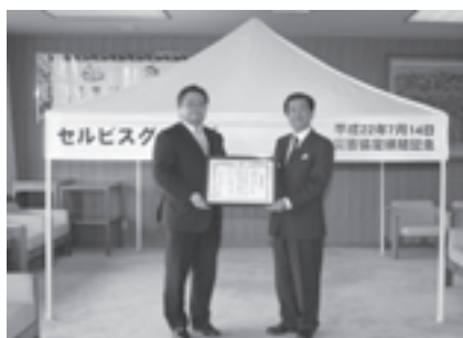
㈱セルビスから寄贈を受ける

市では、NTT西日本と災害時に避難住民などへ提供する特設公衆電話の設置や利用についての覚書を締結しました。これまで同社では、災害時に避難所などで利用する特設公衆電話の回線を災害が発生してから設置していましたが、東日本大震災の教訓として避難住民などが早期に通信手段を確保する必要性から、同社から特設公衆電話の事前設置について市へ申し出があり、今回の覚書締結に至りました。特設公衆電話は、災害時の通話は無料で、一般電話と比べつながりやすくなっており、災害時には、市職員が施設内の電話機を回線に接続することですぐ利用が可能となります。市では、避難住民や帰宅困難者らが身内や知人の安否確認や緊急連絡用に、避難所35施設に設置しました。