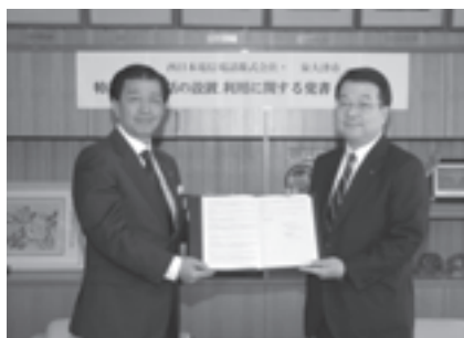
NTT西日本と覚書を締結