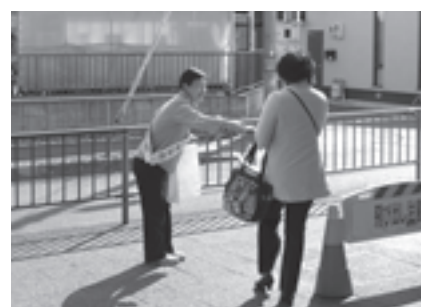
泉大津駅など市内3か所で人権街頭啓発

また、27日には、市民会館で泉大津安全大会が開催され、約180人の市防犯委員が出席し、府警生活安全指導班による防犯教室が行われ、防犯意識が高められました。