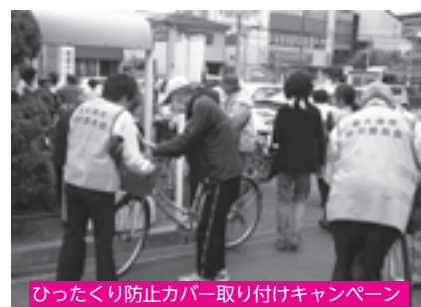
ひたくり防止カバー取り付けキャンペーン

4月12日、住友ゴム工業㈱泉大津工場から、「児童福祉の向上に貢献できれば」と子育て支援用品として、児童が安心して遊ぶための保育室に敷くクッション性マットの寄贈を受けました。寄贈品一式は、公立保育所7か所にて使用します。