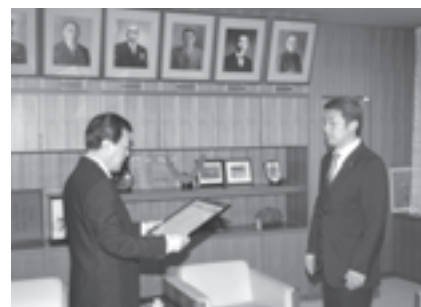
住友ゴム工業㈱泉大津工場から寄贈を受ける

同社からの防災対策用品の寄贈は、今回で3年連続となり、昨年度は、東日本大震災を教訓に津波災害対策をするなか、市域の津波浸水予想地域を中心に海拔を表示したシート300枚の寄贈を受け、市内の電柱に設置し活用しています。