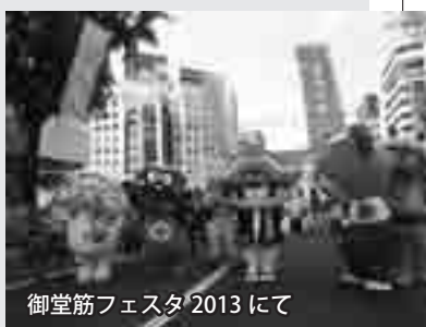
御堂筋フェスタ2013にて

今年は飲料メーカーのCM出演が決まり、女優の新垣結衣さんと一緒に、全国から選ばれたご当地キャラクターたちと共演を果たしました。CMは今年の2月から、約1年間を通し放映される予定なので、今もテレビで愛嬌をふりまくおづみんを見ることができます。他にも、昨年10月に彦根市で行われた「ゆるキャラまつり」や、今年5月に大阪市で行われた「みんなde kappo！御堂筋フェスタ2013」などに出演しました。