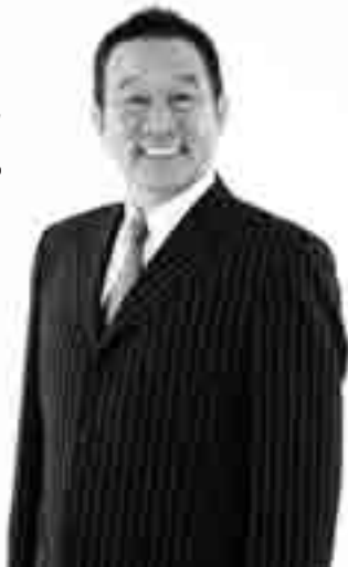
引き続き本市名誉大使への就任が決まったオール阪神氏