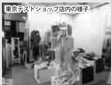
東京テストショップ店内の様子

平成25年2月4日(月)～10日(日)、市は日本毛布工業組合に委託し、全国一の生産量と高い製造技術を誇る毛布産業と産地泉大津のPRと、オーガニックコットンなど素材にこだわった毛布などの新たな魅力による消費者の拡大を目的として、経済、流行の中心地である東京都港区南青山の表参道に「東京テストショップ」を出店しました。