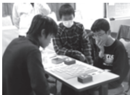
こども将棋大会を開催

また、現在、市内を「おづみんのパッカー車」が走っており、車のボディには「ごみも分ければ資源に変身!!」とおづみんがごみの分別を啓発しています。見かけた人はいますか？ 今後ともごみ減量・分別にご協力をお願いします。