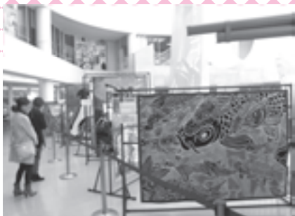
「アートブランケット」を展示