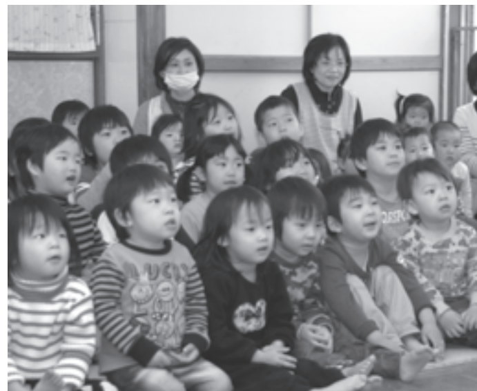
桃の節句をお祝い