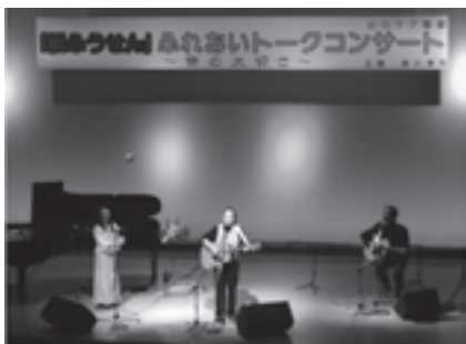
ふれあいトークコンサートを開催