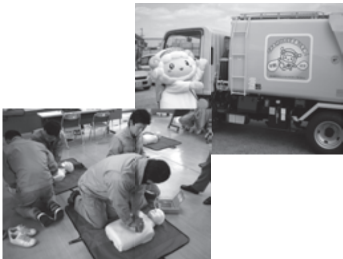
ごみ収集業務に携わる現場職員研修会を開催

記念大会とあり、大勢の人たちが沿道に集まり、懸命に走るランナーたちに小旗を振るなどして、大きな声援をおくっていました。