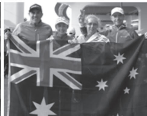
泉州国際市民マラソンに友好都市ランナーが出場