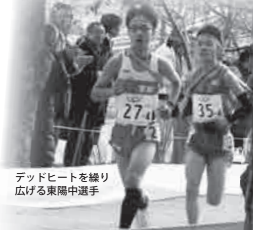
デッドヒートを繰り 広げる東陽中選手

今回の大会の出場にご支援いただいた皆さん、また、防寒用に毛布をご寄贈いただいた日本毛布工業組合様に、心より感謝申し上げます。