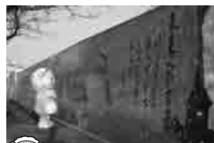
④春日町墓地壁面（春日町）

この展示初日のセレモニーでは、氷で作られたおづみんの氷像もお目見えし、そのできばえに、訪れた人たちは感心していました。