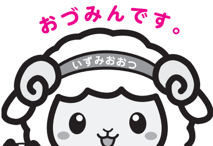
市内のとある毛布工場生まれ