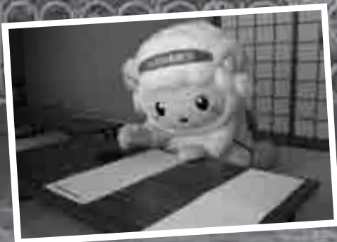
初めての書き初めにチャレンジするおづみん