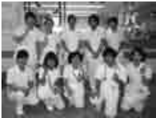
小児科病棟スタッフ。小児科専用の病棟で小児科領域に特化した看護を行っています