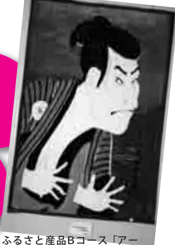
ふるさと産品Bコース「アートブランケット」

ふるさと納税制度による本市への寄付促進と、地元特産品などのPR・販売促進などの相乗効果を図るため、平成25年1月から、ふるさと納税により本市に寄付いただいた皆さんに、本市の魅力を実感し、懐かしんでもらえるものをお礼の品「ふるさと産品」としてプレゼントします。