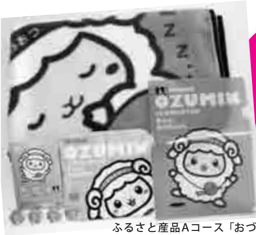
ふるさと産品Aコース「おづみんグッズセット」

なお、郵便等投票証明書には有効期限があります。期限の過ぎた証明書をお持ちの人は、早めに更新手続をしてください。