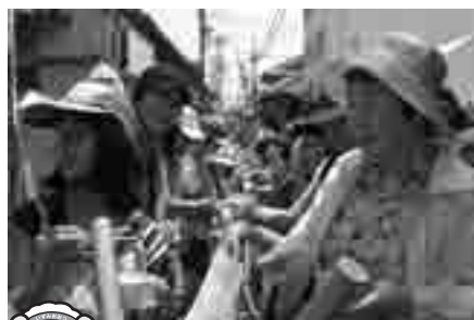
②浜街道（東港町・神明町など）

泉大津駅前に、高さ 5 m の巨大おづみんが誕生し、本市を訪れる人の興味を引きつけていました。除幕式の日にはテレビなどマスコミ取材も入り、注目を集めました。市民団体・いずみおおつ元気会主催で、大阪芸術大学の協力のもと生まれたこのモニュメントは、夜にはイルミネーションが点灯し、携帯電話などで写真を撮る人も多く見られ、本市の P R にひと役買っていました。