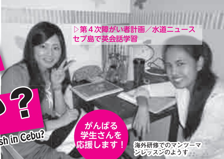
▷第4次障がい者計画／水道ニュース セブ島で英会話学習