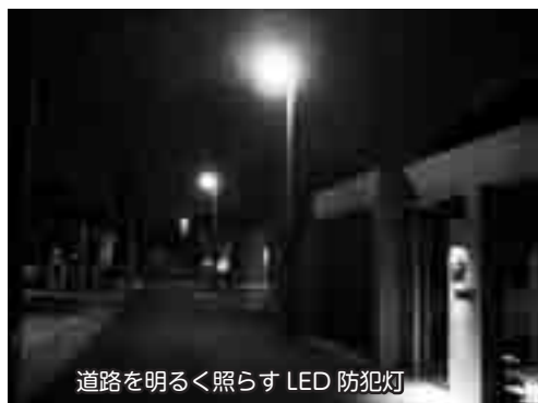
道路を明るく照らす LED 防犯灯

ご家庭のまだ使えるものはありませんか？ もう使わないけどごみに出すのはもったいない。そんな品物、眠っていませんか？ あなたにとって不用品なものでも、ほかの誰かに必要とされるかもしれません。ぜひ市役所に設置している「不用品あっせん掲示板」をご利用ください。詳しくは、12月中旬に配布するチラシ、ホームページをご覧ください。