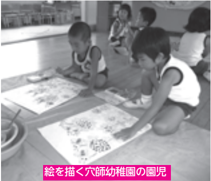
絵を描く穴師幼稚園の園児