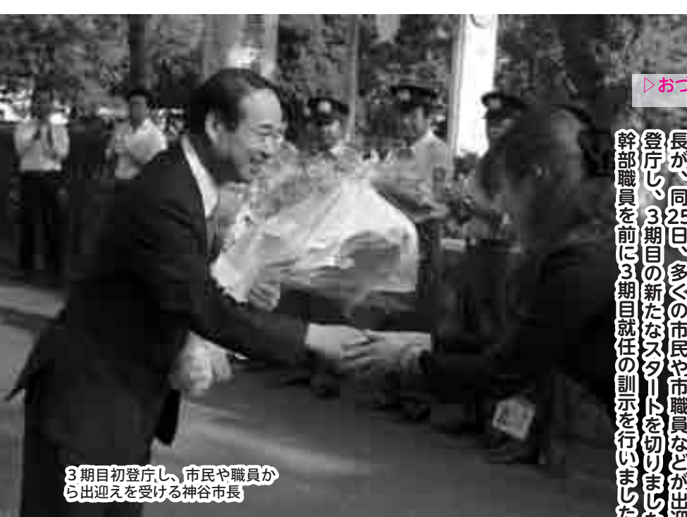
3期目初登庁し、市民や職員から出迎えを受ける神谷市長